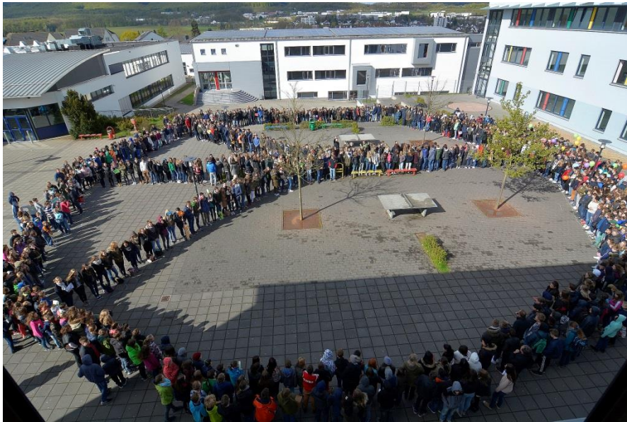
26.04.2016 am internationalen UNESCO-Tag

Unser Leitbild Limeschule einzelN wichtig gemeinsam stark